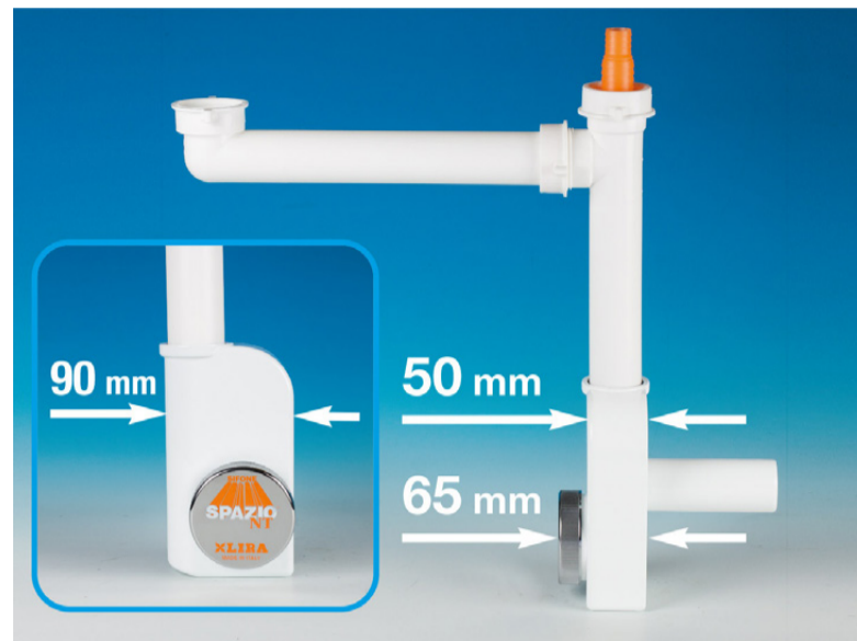
QUOTE indicanti le ridotte dimensioni e spessore

Disponibile nei colori bianco, nero e grigio metallizzato, il sifone Spazio 1NT EVOLUTION offre una possibile opzione di