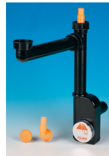
VERSIONE colore nero