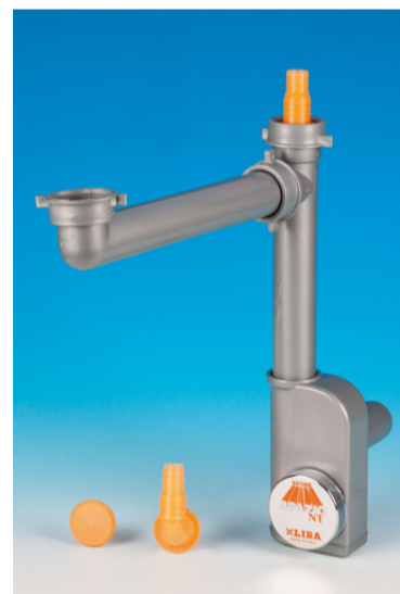
VERSIONE colore grigio