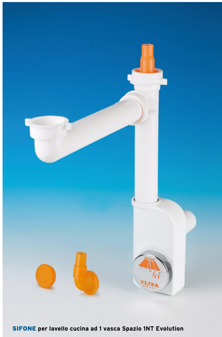
SIFONE per lavello cucina ad 1 vasca Spazio 1NT Evolution

Un elemento distintivo del Sifone Spazio 1NT EVOLUTION è l'ispezionabilità, come peraltro tutti i sifoni della gamma NT. Ciò significa che è possibile rimuovere facilmente i residui accumulati nello scarico, prevenendo fastidiosi ingorghi che potrebbero compromettere il deflusso dell'acqua. Svitando il tappo posizionato nella parte anteriore, il sifone diventa facilmente accessibile per la manutenzione.