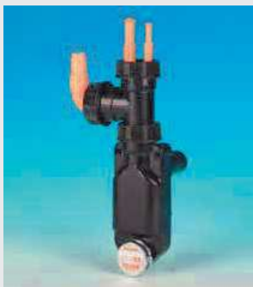
versione con TEE