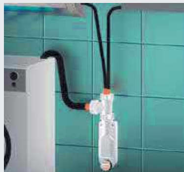
esempio di applicazione con collegamento a 3 utenze