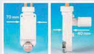
quote illustranti ridotto ingombro