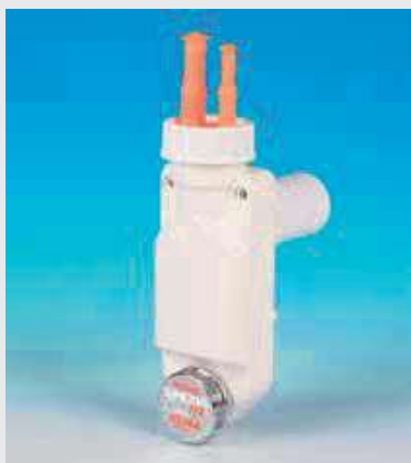
Spazio NT Klima per lo scarico di acqua e condensa

Il sifone ispezionabile Spazio NT Klima di Lira è stato appositamente progettato per far defluire gli scarichi di caldaie a condensazione, climatizzatori, deumidificatori, asciugatrici, lavatrici e lavastoviglie