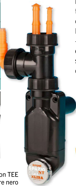
Spazio NT Clima versione con TEE colore nero