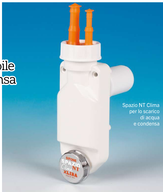
Spazio NT Clima per lo scarico di acqua e condensa

Molti dispositivi ed elettrodomestici presenti nelle abitazioni producono o raccolgono acqua durante il loro funzionamento, non sempre sono previsti tutti gli scarichi a loro necessari e spesso lo spazio è limitato. Il sifone Spazio NT Clima di Lira è studiato appositamente per risolvere le possibili combinazioni inerenti lo scarico di acqua e condensa. Con una forma rettangolare e ridotte dimensioni - 70