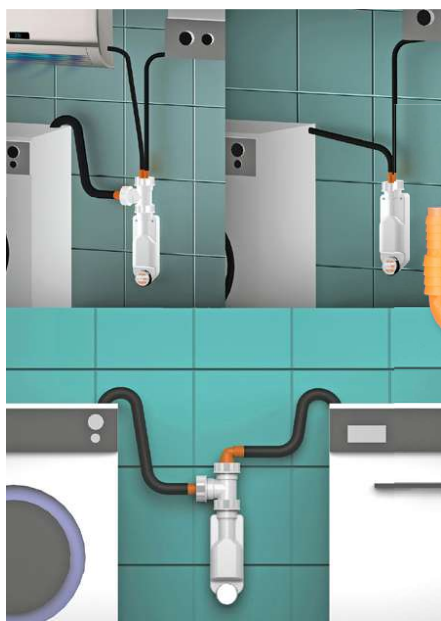
Esempi di applicazione con collegamento a più utenze

Spazio NT Clima dispone di un portagomma con doppio attacco che riceve tubi di diametro 8 -12 e 14 -16 tipici dei dispositivi che rilasciano condensa come caldaie, climatizzatori, deumidificatori e asciugatrici. Con l'aggiunta di un TEE, già incluso nel kit confezione, si estende ulteriormente il numero delle utenze collegabili, il sifone può montare anche un attacco con diametro 20 - 25 mm divenendo così compatibile con gli scarichi di lavatrici e lavastoviglie. Il prodotto offre diverse opzioni di collegamento a seconda delle specifiche esigenze e della quantità di apparecchi da collegare. Il tubo di uscita ha diametro 32, nel kit è incluso anche l'adattatore per l'innesto del sifone in prese a muro di 40 mm. Spazio NT Clima è disponibile in due versioni colore: bianco e nero. Come tutti i prodotti Lira è realizzato in Italia nello stabilimento di Valduggia, sede dell'azienda.