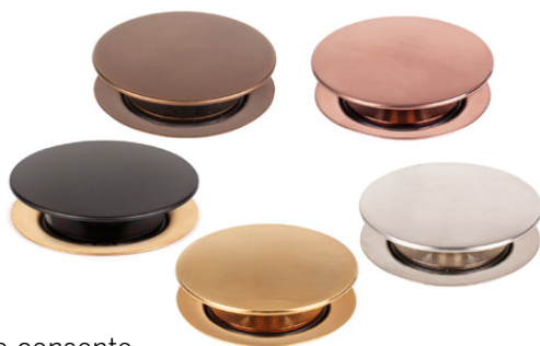
A DESTRA Finiture Basket Bagno Bassa PVD Color Collection

nella parte anteriore consente, svitando il tappo di chiusura, di rimuovere i residui accumulati nello scarico del sifone. Facile da installare: tutti i componenti sono forniti di una lunghezza compatibile con qualsiasi applicazione, dal lavabo più grande a quello più piccolo. Essendo realizzati in polipropilene, è possibile tagliarli agevolmente con un tradizionale seghetto. Per sfruttare al massimo le potenzialità del mobile che contiene il lavabo, si può abbinare il sifone alla PILETTA BASKET BAGNO BASSA , che con un ingombro di soli 60 mm agevola lo scorrimento dei cassetti nei mobili da bagno. È dotata di tappo chiusura "No Problem": un dispositivo manuale che permette la chiusura con una semplice pressione