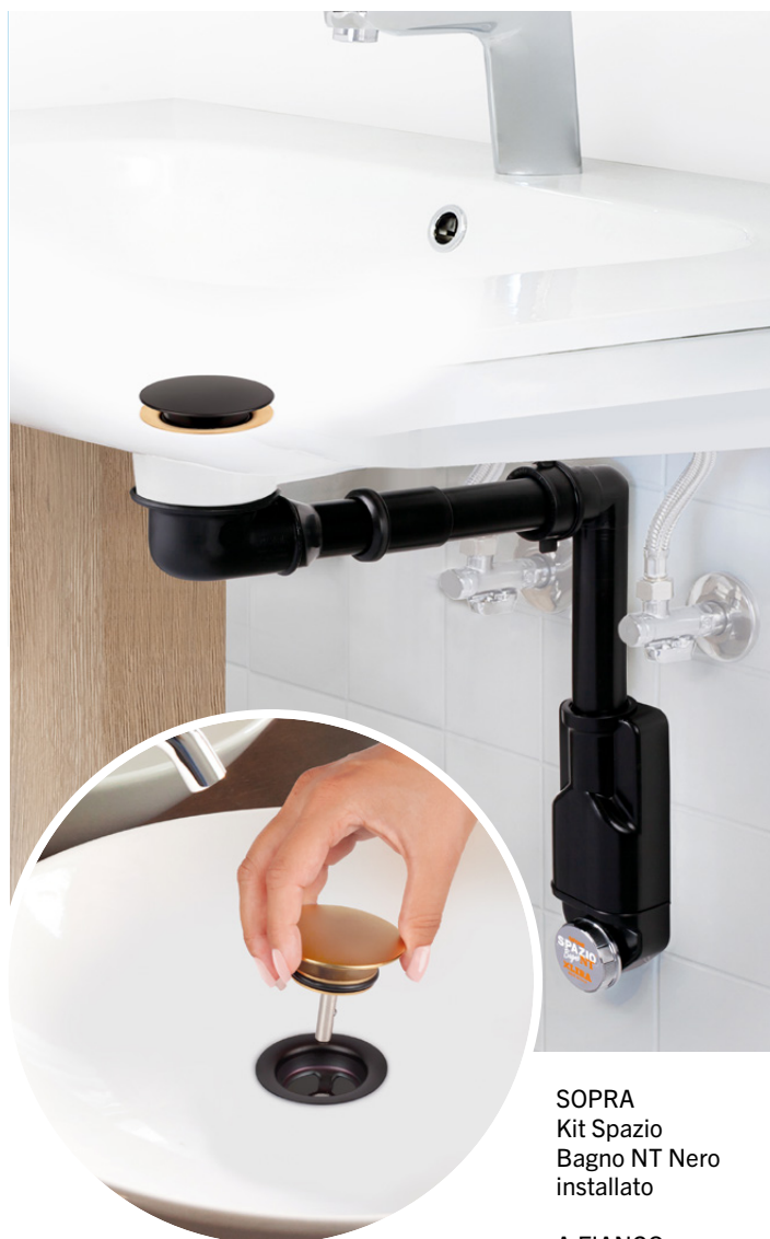
SOPRA Kit Spazio Bagno NT Nero installato

nella parte anteriore consente, svitando il tappo di chiusura, di rimuovere i residui accumulati nello scarico del sifone. Facile da installare: tutti i componenti sono forniti di una lunghezza compatibile con qualsiasi applicazione, dal lavabo più grande a quello più piccolo. Essendo realizzati in polipropilene, è possibile tagliarli agevolmente con un tradizionale seghetto. Per sfruttare al massimo le potenzialità del mobile che contiene il lavabo, si può abbinare il sifone alla PILETTA BASKET BAGNO BASSA , che con un ingombro di soli 60 mm agevola lo scorrimento dei cassetti nei mobili da bagno. È dotata di tappo chiusura "No Problem": un dispositivo manuale che permette la chiusura con una semplice pressione