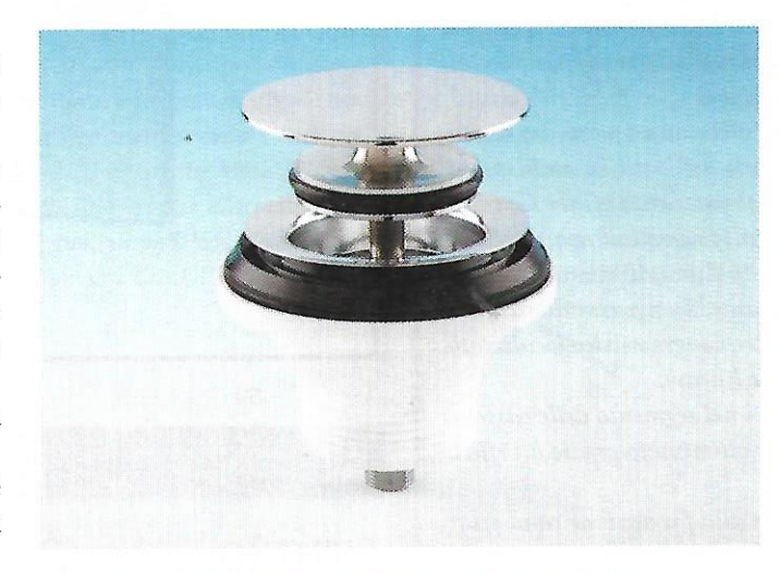
La Piletta Basket Bagno, come tutti i prodotti Lira, è realizzata in Italia nello stabilimento di Valduggia, sede dell'azienda.