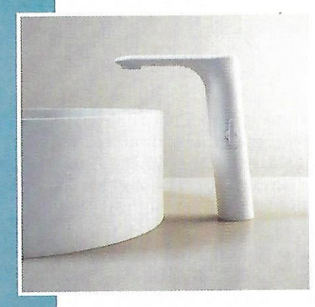
I rubinetti della serie Otto uniscono estetica ed elevate prestazioni

Idral, in collaborazione con il designer Luca Papini, realizza una gamma di rubinetti e miscelatori elettronici che uniscono innovazione tecnologica e design. I rubinetti della serie Otto combinano la semplicità delle linee ergonomiche con la varietà di combinazioni, finiture e colori che permettono soluzioni creative in ogni spazio. Hanno diverse altezze, per adattarsi a qualsiasi tipo di lavabo, una gamma di finiture speciali e la possibilità della combinazione bicolore per individuare l'opzione adatta da integrare nel progetto. Molto facili da usare grazie al sensore infrarosso, importante quando si vuole rendere il bagno più accessibile a tutti. La tecnologia ad infrarossi non richiede di entrare in contatto con nessuna superficie per controllare il flusso d'acqua offrendo maggiore sicurezza all'utente e minimizzando i pericoli di contaminazione incrociata. Sono dotati di sistema di risciacquo automatico ogni 24 ore dopo l'ultimo utilizzo che permette di prevenire la proliferazione di germi come la legionella. Progettati per uso frequente, permettono di ridurre lo spreco d'acqua, la manutenzione è semplice grazie alla possibilità di rimuovere la cover superiore senza ulteriori interventi.